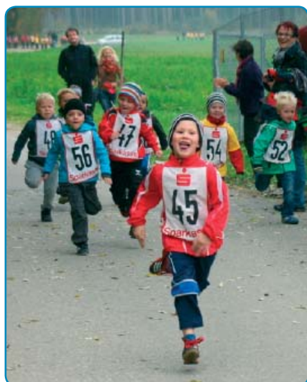
Kinder beim Haribolauflauf 2012.

Insgesamt 76 Kinder waren beim Haribolauflauf im Einsatz und gaben ihr Bestes. Beim Fitlauf hatten 145 Sportler Spaß an der Bewegung. Somit konnten wir uns über 216 Teilnehmer freuen.