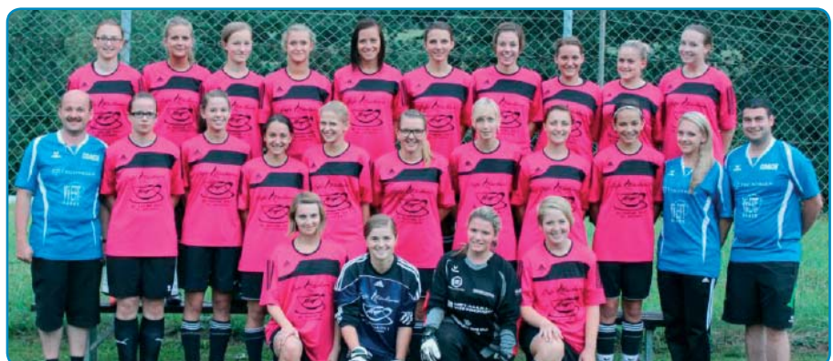
Überraschten in der Frauenklasse Ost: die Kickerinnen Union Pettenbach/St. Konrad

Hagenberg zuhause mit 1:0 eliminieren konnten, können wir vielleicht auch die drei „Großen“ vor uns, „ein wenig ärgern“, setzt der Coach auf die Heimstärke und die Unterstützung durch die zahlreichen heimischen Fans.