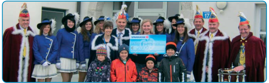
Übergabe des Schecks der Faschingsgilde Sauzipf an den Kindergarten.

Angeführt vom Elferrat, dem amtierenden Prinzenpaar und den Gardemädchen wurde am 11.11. um 11.11 Uhr das Gemeindeamt von der Faschingsgilde Sauzipf in Beschlag genommen.