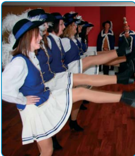
Die Gardemädchen bei der Gardepolka.

Die Gardemädchen zeigten ihre Gardepolka und die Faschingsgilde hatte sich wieder eine kabarettistische Einlage einfallen lassen.